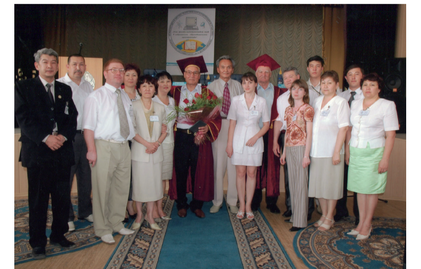
Меншік иесі: Х.Досмұхамедов атындағы Атырау университеті